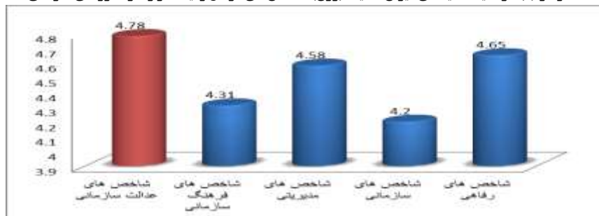
نمودار (۱): وضعیت مقایسه‌ای میزان اهمیت (وزن) شاخص‌های عوامل زمینه‌ساز رفتار شهروندی سازمانی

نمودار بالا گویای آن است که بین شاخص‌های عوامل زمینه‌ساز رفتار شهروندی سازمانی تفاوت معناداری وجود دارد. این امر با توجه به فاصله‌های اطمینان ۹۵ درصدی نشان داده شده در نمودار برای هر شاخص قابل مشاهده است. همچنین بر اساس این نمودار مشاهده می‌شود که پاسخگویان این طور عنوان کرده‌اند که به ترتیب میانگین شاخص‌های عدالت سازمانی، شاخص‌های رفاهی و شاخص‌های مدیریتی از وزن یا اهمیت بالاتری برخوردار است. همچنین شاخص‌های سازمانی و فرهنگ سازمانی کم‌ترین میانگین را کسب نموده‌اند.